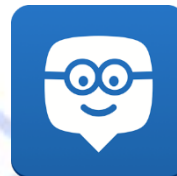
Ilustración 6 Logo Edmodo

Edmodo es una red educativa global que ayuda a conectar a los estudiantes con la gente y recursos necesarios para desarrollar todo su potencial (“Edmodo”, 2017). Conocida como “La Red Social de los Profesores” es un aula virtual que posee una interfaz similar a la de Facebook, lo cual hace su manejo más sencillo, permitiendo la publicación de comentarios en nuestro “muro” y la posibilidad de contestarlos y generar una conversación a partir de dicha publicación.