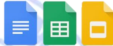
Ilustración 4 Documentos, Hoja de cálculo y Presentaciones de Google

Es un conjunto de aplicaciones en línea desarrollado por la G-Suite de Google para competir contra el Office de Microsoft es una herramienta 100% online, permitiendo una colaboración segura y en tiempo real mediante un equipo conectado a internet y un programa llamado “buscador” o navegador web, el cual nos proporciona los medios necesarios para poder interactuar con ellas. Al ser parte de Google necesitamos una cuenta de Google o de Gmail para poder acceder a ellas (“G Suite - Google Apps”, 2017).