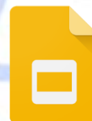
Ilustración 3 Logo de Presentaciones de Google

Similar al programa Microsoft PowerPoint de Office para trabajar con diapositivas y realizar presentaciones electrónicas, creativas, atractivas e interactivas. Para poder acceder a esta aplicación de Google debemos de contar con una cuenta Google o con una cuenta de Gmail. Posee una interfaz similar a la del programa de Office lo cual es muy ventajoso porque nos sentimos seguros al trabajar en este entorno. Para poder acceder a esta aplicación debemos de hacerlo por medio de la aplicación Drive y dar click al botón azul que dice Nuevo.