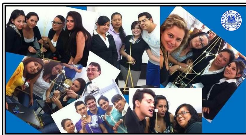
Licenciatura en Administración de Empresas Turísticas Generación 2011-2014. Plantel Satélite. (2014)